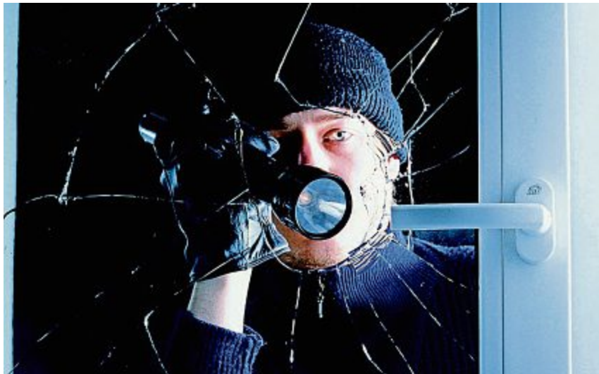
Die Zuger Kriminacht 2018 wird am 31. Oktober in der Stadtbibliothek durchgeführt und sorgt für jede Menge Spannung.