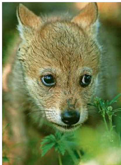
Ein junger europäischer Wolf (Canis lupus) im Langedrag Zoo, in Norwegen. Staffan_Widstrand_WWF

Das Stück erzählt die Geschichte eines Nachtwächters, der sich mit einem Wolf anfreundet. Theaterspieler Thomy Truttman beeindruckt, dass dieses Tier Ängste aber auch Bewunderung auslöst: «Diese Gefühle auf der Bühne darzustellen, fasziniert mich».